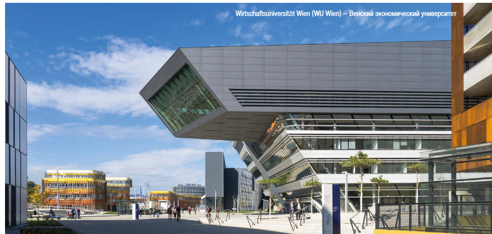
Wirtschaftsuniversität Wien (WU Wien) — Венский экономический университет

Johannes-Kepler-Universität Linz — Университет имени Иоганна Кеплера г.Линц