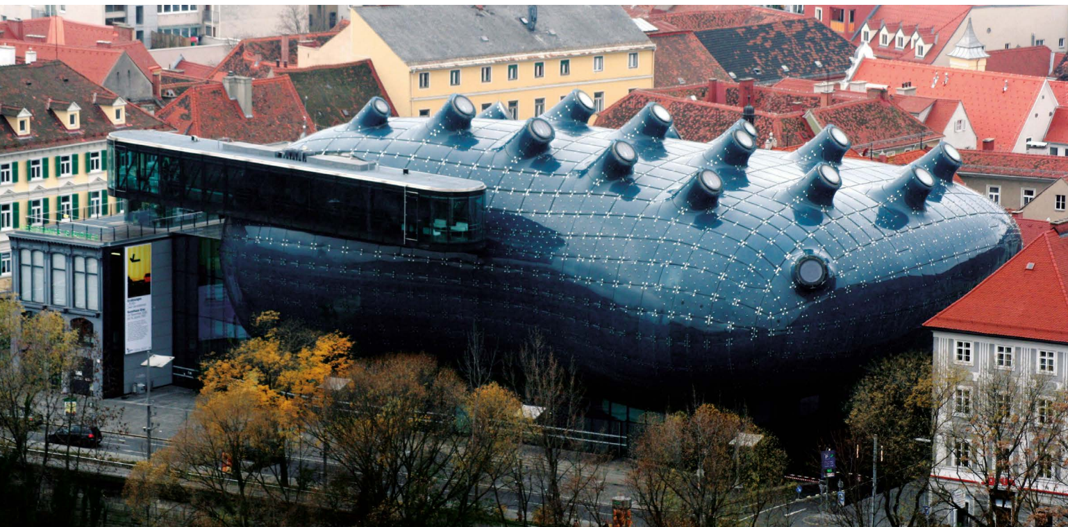
Kunsthaus. Graz — Кунстхаус г. Грац