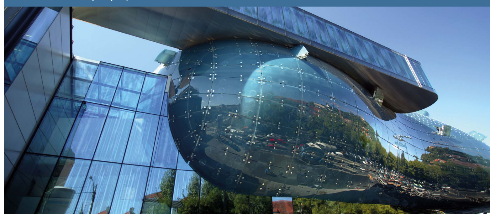
Kunsthaus. Graz — Кунстхаус г. Грац

Помимо права работы по найму Вы также можете оформить частное предпринимательство в Австрии. Все подробности на сайте Экономической палаты Австрии: https://www.wko.at