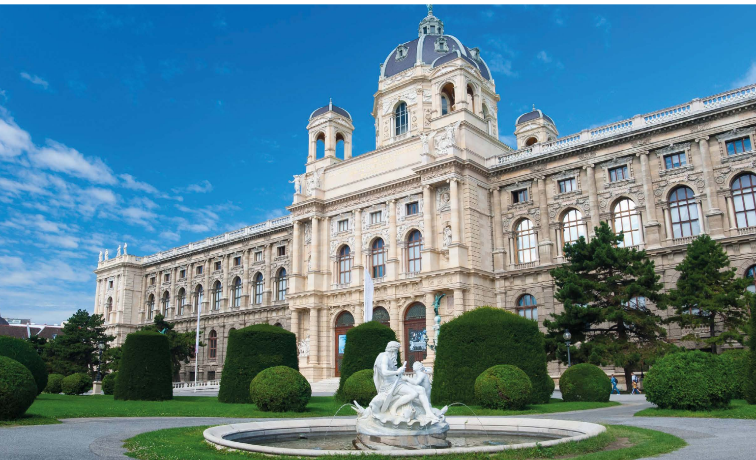
Natural History Museum – Музей естествознания