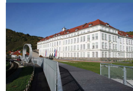
Donau-Universität Krems — Университет повышения квалификации г. Кремс

Федеральная клиника (неотложка): Steiermärkische Krankenanstaltengesellschaft m. b. H. LKH-Univ. Klinikum Graz Auenbrugger Platz 1 8036 Graz Tel: +43 316 385-0 Tel: +43 316 385-12345