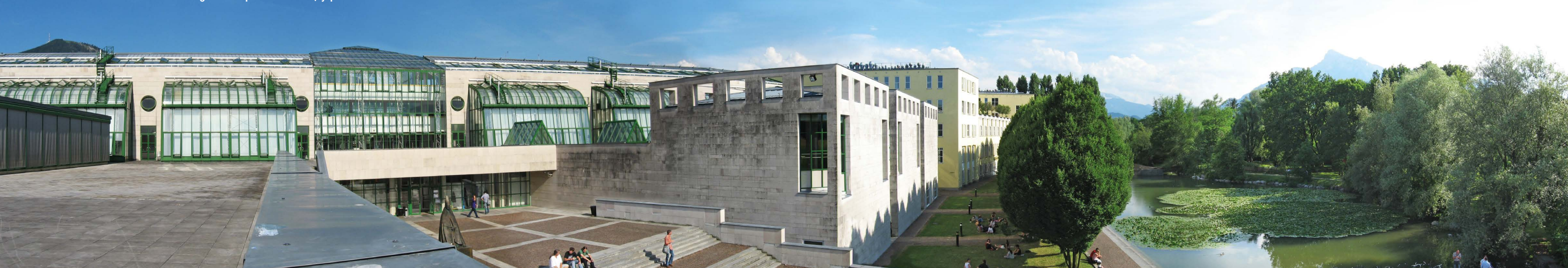
Paris-Lodron Universität Salzburg — Университет г. Зальцбург

Принятие решения о поступлении лежит полностью на Вас. Мы лишь даем Вам полную информацию обо всех организационных моментах. Ну и, разумеется, организуем для Вас поступление под ключ, если это необходимо.