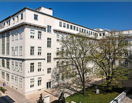
Medizinische Universität Wien (MUW) – Венский медицинский университет

Залог — это четко обозначенная денежная сумма, которую арендатор передает арендодателю в качестве гарантии на все время аренды и которая, после истечения срока договора аренды, возвращается арендатору при отсутствии задолженностей (ком. платежи и др.) и претензий к имуществу. Размер залога, как правило, составляет три месячные арендные платы брутто. После передачи залога, не забудьте потребовать расписку или квитанцию.