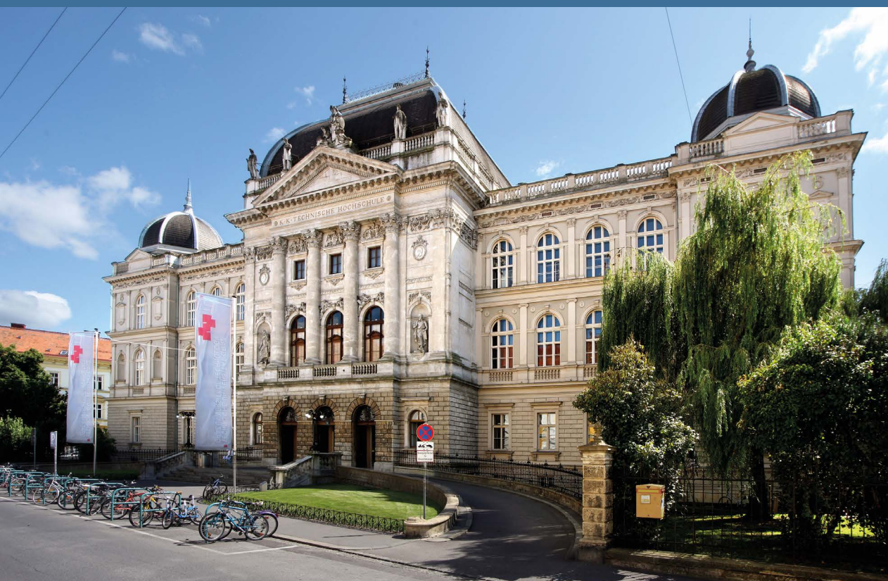
Technische Universität Graz (TU Graz) – Технический университет г. Грац